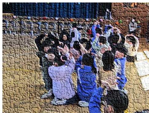
【クイズ大会の一コマ】

六年生へのお礼より 振り返ってみると、皆さんは、私たちにとって「憧れのヒーロー」でした。全校の手を引き歩いて行く姿、委員会やクラブでテキパキと仕事をこなす姿、そして、学校全体を明るく盛り上げていく力強い姿、私たちが困っている時には、一番に気付けてくれて優しく声をかけてくれました。その頼もしい背中を見るたびに、私たちも「頼もしい六年生になりました！」と、何度も心の中で思いました。皆さんがいてくれるだけで、平館小学校がパッと明るくなり、どんなことでも乗り越えられるような安心感がありました。まさに、この学校のみんなを支えてくれた「頼りになる最高のヒーロー」それが、六年生の皆さんです。 皆さんと過ごす時間はあと少しになります。さみしい気持ちはいっぱいですが、私たちが六年生みたいな「最高で頼りにする六年生」になれるように一生懸命がんばります。六年生も中学校でも一生懸命がんばってください。