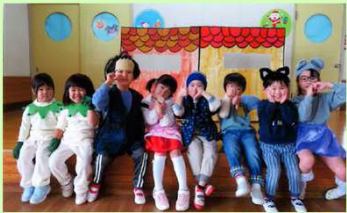
▲3歳・4歳・5歳の子どもたちが「おおきなうた」を熱演!うんとこしょ!どっこいしょ〜!