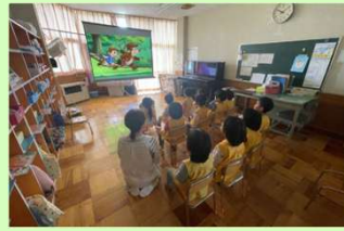
▲面白かった!と沢山感想もらいました♪

12月18日(木)に年内最後の「幼児映画会」を行いました。今回は「チップ&デール〜リスのいたずら大作戦」を見ました。コミカルな動きにたくさんの笑い声が聞こえる映画会となりました!