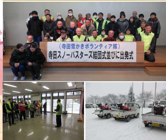
▲出発式当日、昨年同様大雪に歓迎され、屋内での出発式になりました!

尻すべり速いぞはやい初雪よ さわめくや街を彷徨う熊の影 歳晩に花豆を煮る鍋の音 年の暮れ体病み病み歳の暮れ 「坊っちゃん」をさがす日となり漱石忌 大挙して水田おほひし大白鳥 縄なふや祈る仕種をくりかへし 旋風落葉に乗りて舞ひ上る さちこ あつこ えつこ ともあき きみ系 ひろし 一夫 白雲