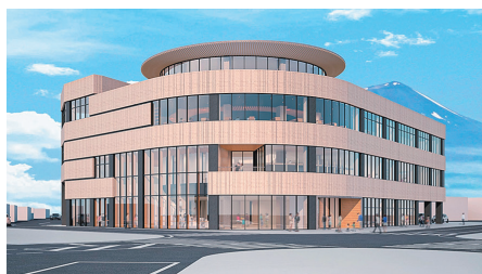
大更駅前に建設を進める「市交流複合施設」の愛称が「8テラス」に決定