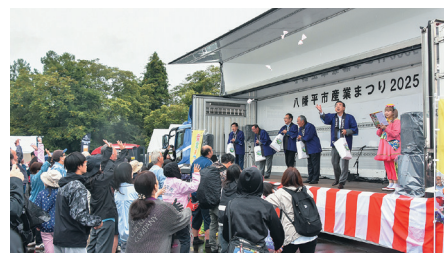
本市の魅力を幅広く紹介する市産業まつりを開催（7年9月20日、松尾総合運動公園）