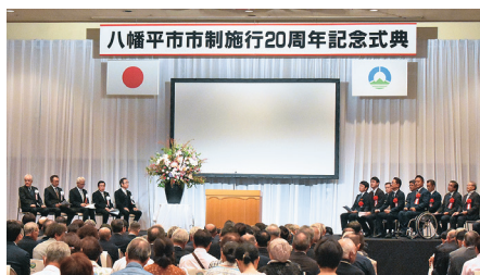
市制施行20周年を祝い、記念式典を挙行政（7年8月31日、安比高原プラザホール）