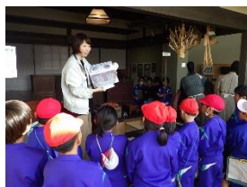
大更小3年生社会科見学(11/7)