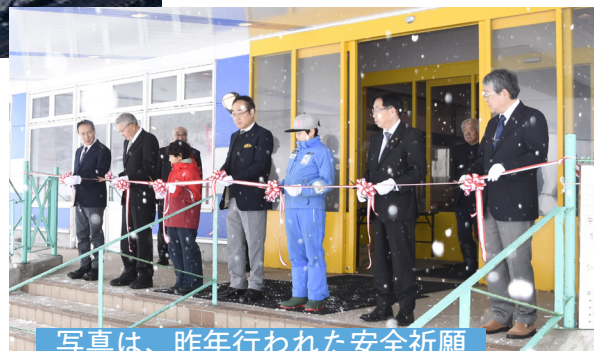
写真は、昨年行われた安全祈願祭の様子(令和6年12月21日)

ノーマルヒルジャンプ台、クロスカントリーコース、バイアスロンコース、夏季のエバースノージャンプ台、ローラースキーコースも備え、国体やインカレ、インターハイ、全中などの全国大会の会場としての実績も有するスキー場です。