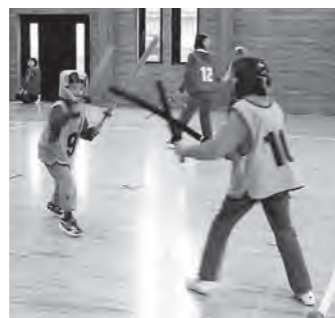
コミセンでスポーツに取り組もう(大更コミセン)

日号から、各コミセンの紹介を開始します。コミセンに移行する上での変更点や活動内容など、幅広く取り扱います。事業の予定や