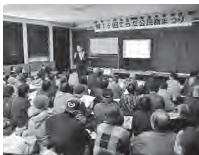
講演などの文化活動も紹介(昨年のてらだ公民館まつり)

報告などを、各コミセン単位で連載することにしていきますので、参加スケジュールをつくるなど、皆さんの活動にお役立てください。