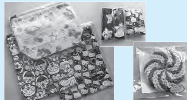
【左】巾着(450~550円) 【中】ティッシュケース(150円) 【右】アクリルたわし(150円)