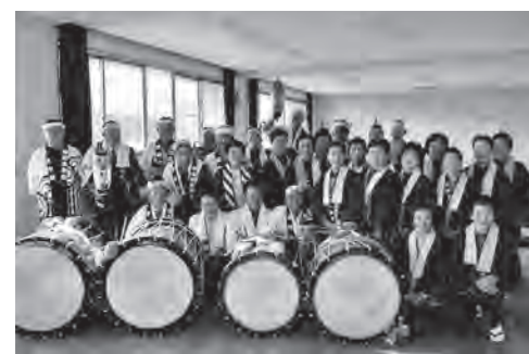
活動を支えてくれる田山地区の皆さん

報告などを、各コミセン単位で連載することにしていきますので、参加スケジュールをつくるなど、皆さんの活動にお役立てください。