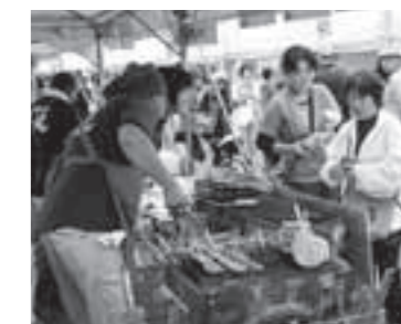
出店をお待ちしています

■その他 売り場スペースや商品の重複については、実行委員会で調整します。また、応募多数の場合、実行委員会で調整します。