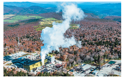
令和6年3月に運転を開始した安比地熱発電所

外へ流出していません。市は今後、電力の地産地消の取り組みを進めることで「クリーンエネルギーを使った企業活動が可能な市」のブランド力向上を図り、環境問題に着目する企業をターゲットにした誘致活動につなげていきます。