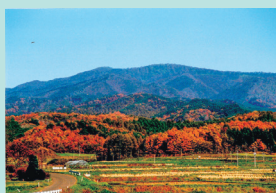
子飼沢山遺跡 遠景

高地性集落跡は、約1,000年前の平安時代に丘陵地や山間部に営まれた集落の跡で、竪穴建物跡が埋まりきらずにくぼみとして残っており、東北地方北部を中心に所在する全国的にも珍しい遺跡です。生活に不便そうな山奥にあるため、地域間の争いから逃れるためにつくられた集落跡、あるいは山をなりわいとした人の集落跡などの説があります。