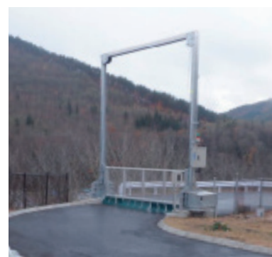
緊急入退出路（下り線側ゲート）