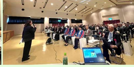
▲地域に於けるコミセンの役割を話すセンター長