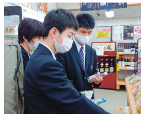
店頭に並ぶ地域ならではの商品を調査する生徒たち

生徒たちは、柔軟なアイデアで熔岩パンやバジルクッキーに続く商品開発を目指して頑張ります。