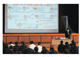
SNS犯罪の事例を紹介

方を学んだ様子で、真剣な表情で講義を受けた生徒たちは、その内容を今後の生活に役立ててくれるものと思います。