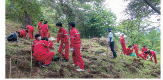
学校の裏山に植栽する1年生

姿に心が癒されました。ムラサキ、そして紫根染を次の世代につなげられるよう引き続き活動を続けていきます。