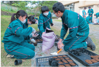
苗のポットあげ作業の準備をする2年生

5月30日に2年生が、植栽予定場所の除草作業や穴掘りなど植栽の準備をしました。その後6月4日には1年生の手で、学校の裏山の斜面にムラサキの