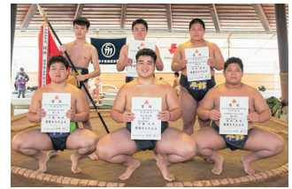
団体戦での優勝を喜ぶメンバーたち

7月31日から始まるインターハイ(大分県宇佐市)では、昨年度の成績(5位)以上を目標に、選手・顧問ともに意気込んでいます。