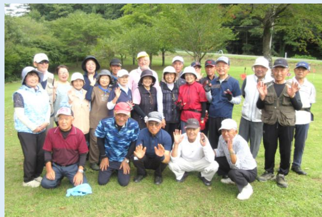
▲暑い日でしたが七時雨の涼しい風に癒されました

9月11日(水) 令和6年度「寺田地区グランドゴルフ大会」を開催しました。当日は各地区から27名の参加者が集い、秋晴れの美しい青空と心地の良い風に包まれながら、3コースをまわりスコアを競いました。チームはくじで決めるので、普段なかなかお話しできない方同士でも会話から笑顔が溢れるとても良い大会でした！入賞した皆さまおめでとうございます！