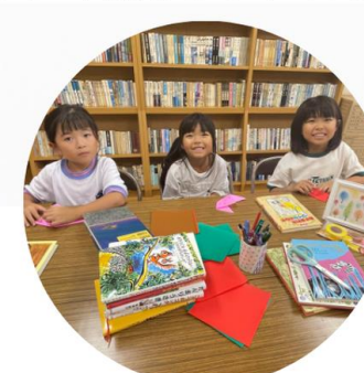
▶宿題やお部屋遊び！ 運動はお庭でね！