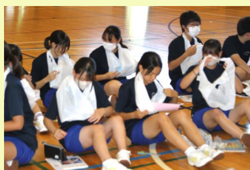
▲ビニール袋をアームホルダーに