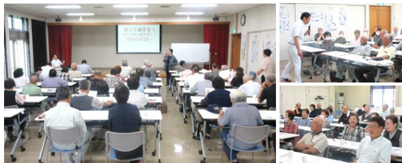
▲参加者からの質問が途切れず、休憩中も先生と相談する方続出！