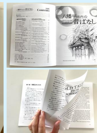
▲英訳付き国際化に対応