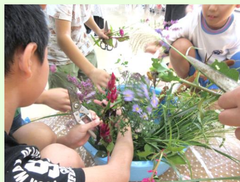
▲畑のあぜ道に咲く日本の美しい野花

9月12日(木)・18日(水) 第4回目「茶道教室寺子屋」にて、生け花を習いました。自然の美を学ぶだけでなく集中力や創造力を育む素晴らしい機会です。花を通じて季節感や礼儀を学び感性を豊かにする体験をお楽しみしました。子ども達から「難しかったけど上手に出来て嬉しい！」という感想をもらいました！