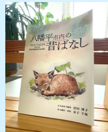
▲とても素敵な表紙絵です！