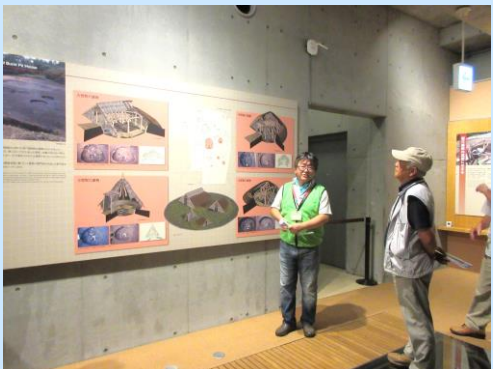
▲八幡平市出身のガイドさんでした！