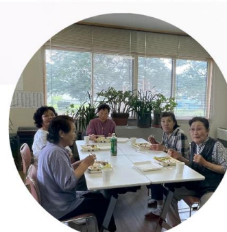
▲飲食お持ち込みで お友達とおしゃべりも♪

飲食の持込もOKです！その場にいる方同士でお話しをして心地よくお過ごしください♪