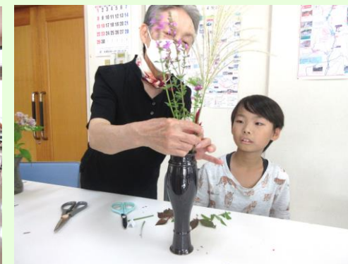
▲ひとりひとり違う花器に活けました。それぞれとっても素敵でした！