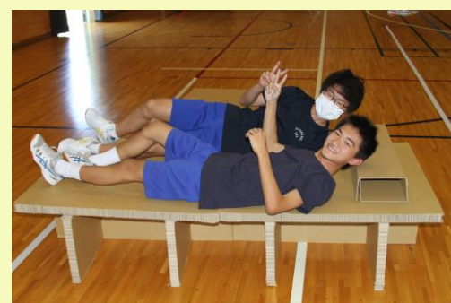
▲段ボールベッドを初めて体験！