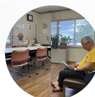
▲ふとした会話から楽しい 企画が生まれるかも？！