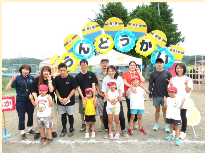
▲6歳児さんは来年卒園！最後の保育園運動会でした ▲かけっこ・綱引き・玉入れ・ダンス・保護者も一緒に参加