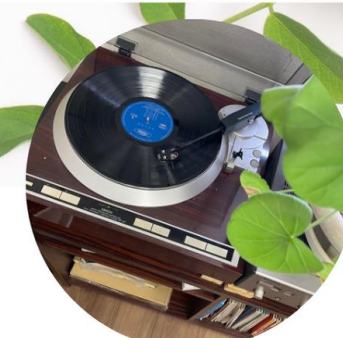
▲談話室にはレコード！ レコードお持ち込み歓迎！