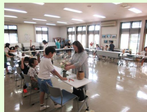
▲ひとりひとり違う花器に活けました。それぞれとっても素敵でした！