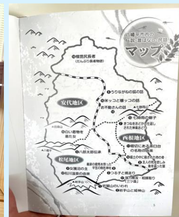
▲市内18話の昔話を掲載