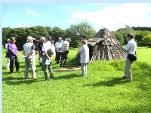
▲800棟を超える竪穴式住居が存在

9月13日（金）平館・寺田自治公民館の研修で25名が世界遺産の御所野縄文公園を訪れ、ガイドの説明を通じて縄文時代の文化や生活を学びました。その後、二戸市の稲庭高原風力発電所を視察し、再生可能エネルギーの重要性や風力発電が地域の持続可能な未来に貢献していることを理解しました。また、研修の後半には懇親会が行われ、参加者同士が交流を深める貴重な機会となりました。お忙しい中、参加していただいた自治公民館長さんありがとうございました。