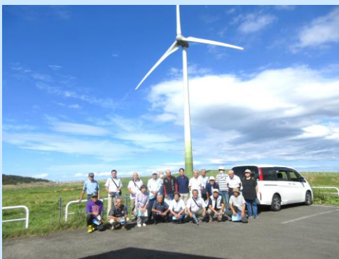
▲未来エネルギーと共に記念撮影！