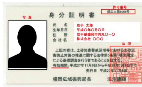
身分証明書のイメージ