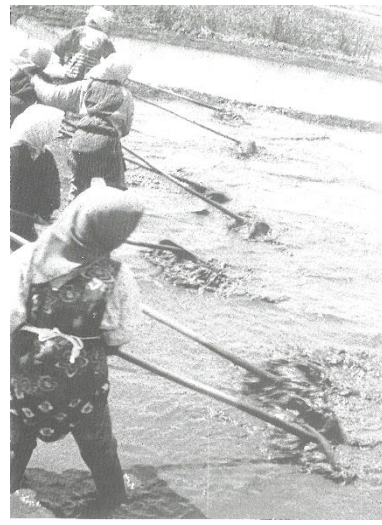
苗代のエブリカき