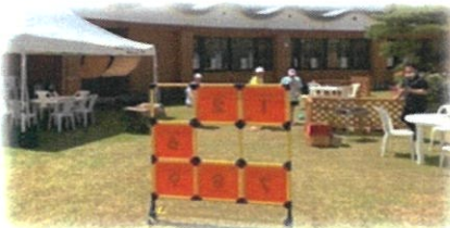
ディスクゲッター