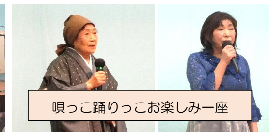
唄っこ踊りっこお楽しみ一座