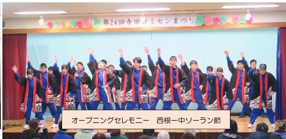
オープニングセレモニー 西根一中ソーラン節