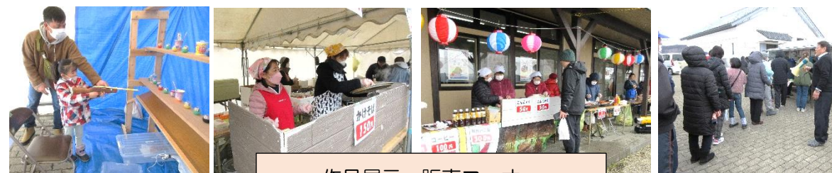
作品展示・販売コーナー

3月9（土）10日（日）、第24回寺田コミセンまつりが開催されました。お天気に恵まれ2,516人というたくさんの来場者で賑わいました。ご協力いただいた皆さん、本当にありがとうございました。心から感謝申し上げます。