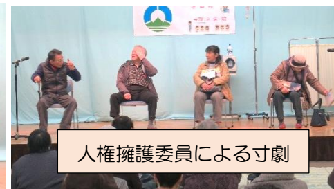
人権擁護委員による寸劇