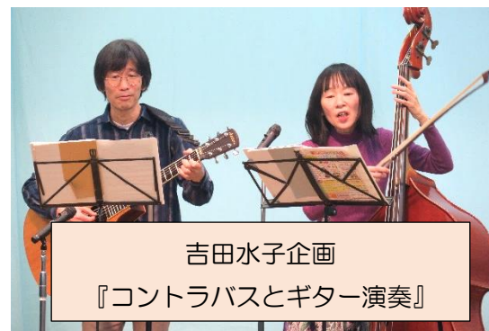
吉田水子企画 『コントラバスとギター演奏』