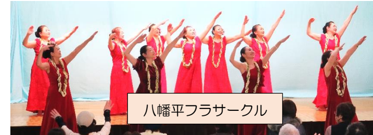
八幡平フラサークル