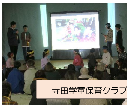
寺田学童保育クラブ 『スライドショー』 & 『ダンス』