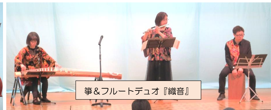
箏&フルートデュオ『織音』