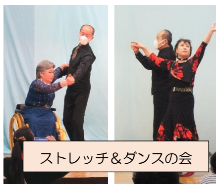
ストレッチ&ダンスの会