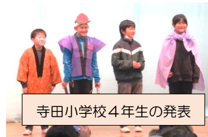
寺田小学校4年生の発表