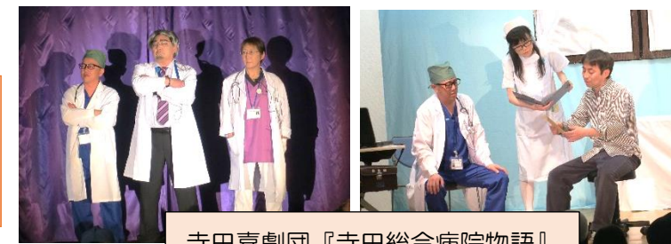
寺田喜劇団『寺田総合病院物語』