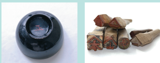
家印入り漆器(左)と家印のはんこ(どちらも市博物館蔵)

現在、結婚式や葬式などの冠婚葬祭行事は式場を借りて行われることが多いですが、かつてはそれぞれの家で行われていました。これらの行事は多くの