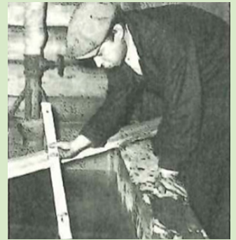
湯加減を見る浴場手

また鉱山の保健施設として運営されている松川温泉には露天の岩風呂もあり、鉱山の人たちに親しまれました。