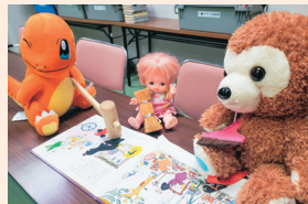
昨年のお泊り会の様子

大好きなぬいぐるみが絵本を読む姿を通して、子どもたちに本に興味を持ってもらおうというイベントです。