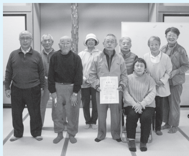
県表彰を喜び、入浴会に集まった会員で記念撮影

11月の入浴会では、10月に県老人クラブから、会員加入促進への取り組み成果を表彰されたことを喜び合いました。