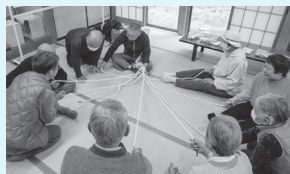
「どっぴき」を楽しむ会員

月に一度、七時雨憩の湯で入浴会を行い、入浴や食事の他に「どっぴき」といって昔遊びで、会員同士の親睦を深めています。