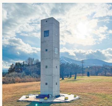
角柱形の現代的な記念碑

そんな安比高原駅を降り立ち、令和4年8月に開校したハロウィンターナショナルスクール安比校を右手に、道なりに10分ほど歩くと『江副浩正記念碑』があります。安比高原スキー場の開発などを手掛けた実業家、江副氏の業績を記念し遺族により建てられた記念碑は、白い花こう岩を組み合わせたデザインで、内側には安比高原スキー場のシンボルマークがあらわれています。一大リゾート地となった安比高原スキー場に臨む斬新な記念碑を見に行きませんか。