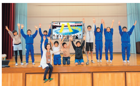
ふるさとCM大賞の応募作品に出演した松野小の児童と完成試写会後の記念写真

これまででの活動で感じた市内の特徴や魅力を踏まえ「第21回IATふるさとCM大賞」へ応募する作品を制作しました。さまざまな人に協力していただき、八幡平市ならではの楽しめるような題材にこだわって作りました。完成したCMは岩手朝日テレビで来年1月に正月特番として放送され、2月上旬から地上波とインターネットで配信される予定です。ぜひ期待してください。