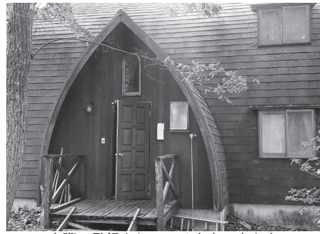
実際に登録されている市内の空き家

市空き家・宅地バンクおよび全国版空き家・空き地バンクに登録する市内の空き家物件や宅地物件を募集しています。 ◎空き家バンク制度