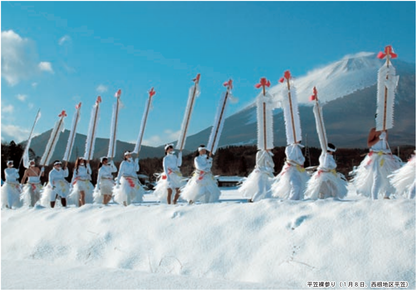
平笠裸参り（1月8日、西根地区平笠）