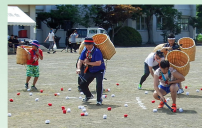
大更、平館、寺田の各地区大運動会が青空の下、4年ぶりに開催されました。(8月27日、平館小グラウンド)