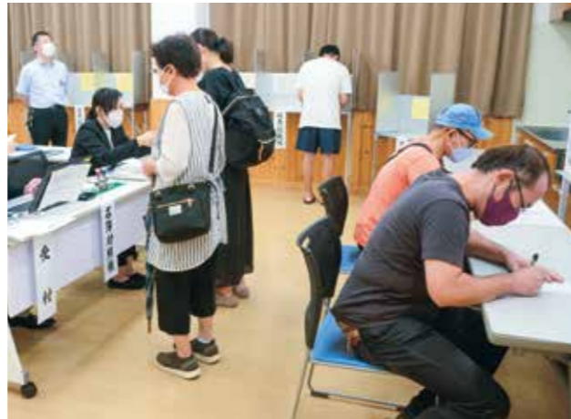
ベルフ八幡平に設置した臨時期日前投票所は280人が利用