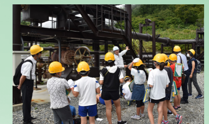
松野小の4年生14人が社会科見学で地熱資源に理解を深めた(9月8日、松尾八幡平地熱発電所)