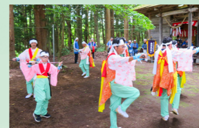
地域の安全や五穀豊穡を願い、曲田先祇の勇壮な舞を奉納(9月17日、曲田地区祭典)