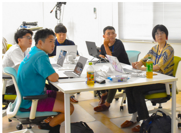
プログラミング技術習得に真剣に臨む参加者