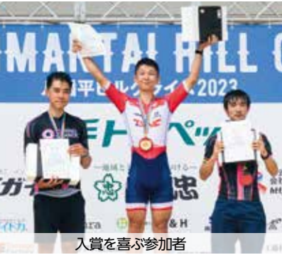
入賞を喜ぶ参加者

このヒルクライムレースは、登り 坂をメインとしたコース設定のレー スで、本市でも、八幡平の地形を最 大限に生かし、2018年から開催して いる人気の自転車レースです。