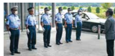
啓発活動に取り組む交通指導員の皆さん(写真:松尾地区交通指導車引き渡し式、7月31日)