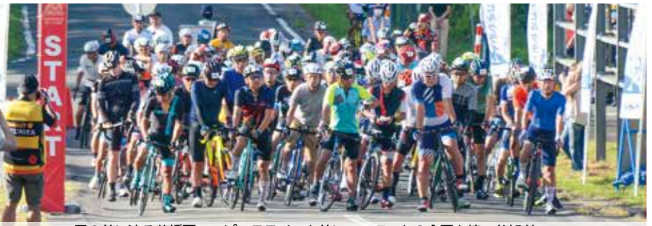
目の前に迫る八幡平アスピーテラインを前に、スタートの合図を待つ参加者