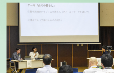
14日間の活動で築いた市民とのつながりを発表(9月14日、地域おこし協力隊インターン報告会)