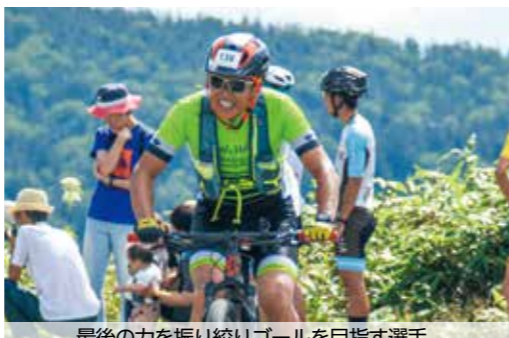
最後の力を振り絞りゴールを目指す選手

“ひたむきに自転車で坂を登る” 自転車レース「八幡平ヒルクライム」 が8月27日、八幡平アスピーテライン で行われました。