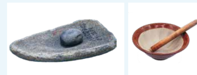
石皿と磨石(約4500年前・八幡平市蔵) すり鉢とすりこ木(近現代)

大昔から見ると、道具の材質は石から木・陶器へと変化しましたが、使い方は大昔と同じまます。