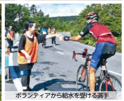
ボランティアから給水を受ける選手