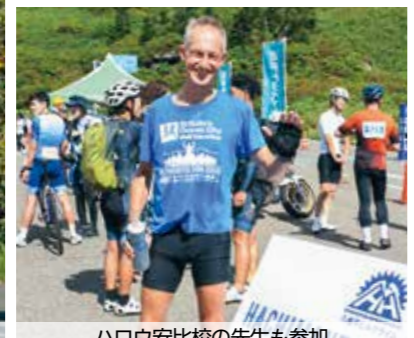
ハロウ安比校の先生も参加