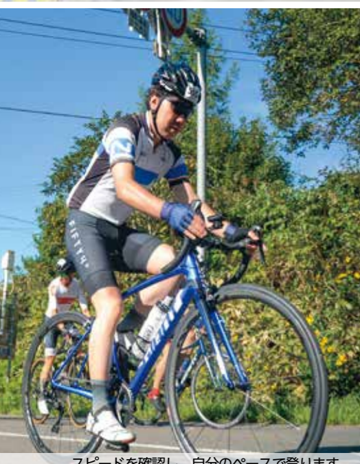
スピードを確認し、自分のペースで登ります