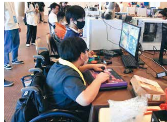
バリアフリーゲーム体験で、快適な操作感を楽しむ参加者