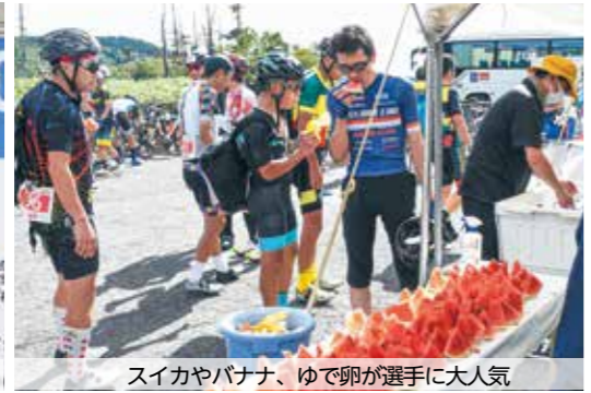
スイカやバナナ、ゆで卵が選手に大人気