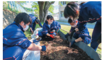
発芽したムラサキ苗のポット上げ

活動の中で、次は自分たちの手で種から育てることに挑戦しようと、昨年9月から11月にかけて地域の人や小学生、盛岡農高生とも一緒に種をまきました。