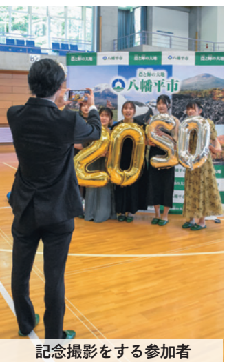
記念撮影をする参加者