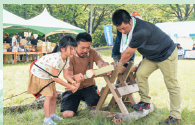
林業機械作業の実演や作業体験を通じ林業の魅力に触れる(8月6日、げんき森林モリフェスティバル)