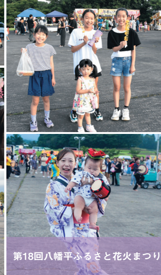
第18回八幡平ふるさと花火まつり