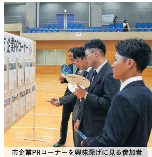
市企業PRコーナーを興味深げに見る参加者