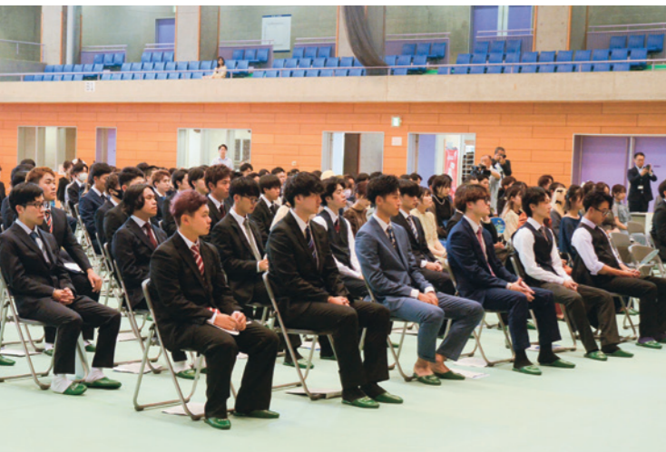
真剣な表情で式典に臨む