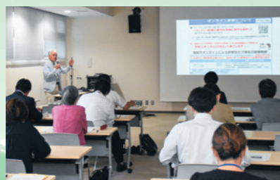
地域医療の課題や今後の取り組みについて国保診療施設関係者などが研究協議(8月19日、県地域医療研究会)