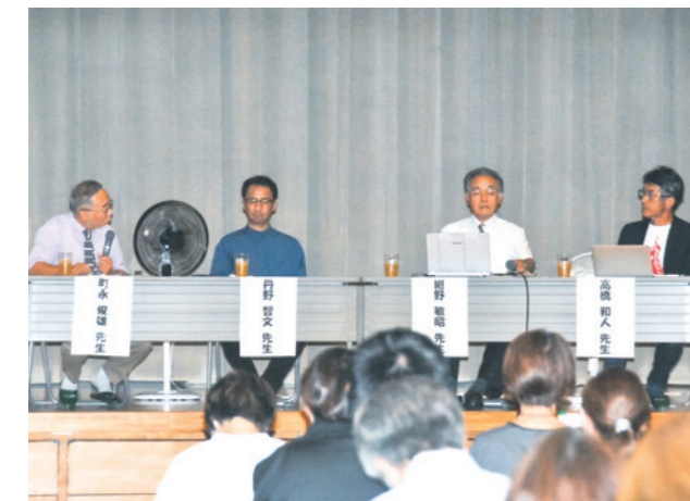
パネルディスカッションで意見交換をする登壇者