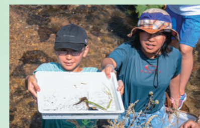
柏台地区の子どもたちが夏休み行事で水生生物を調査。多数の生き物を間近で観察(7月30日、鴨田川)