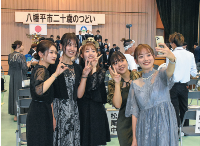
華やかなドレスをまとった旧友たちと記念に一枚