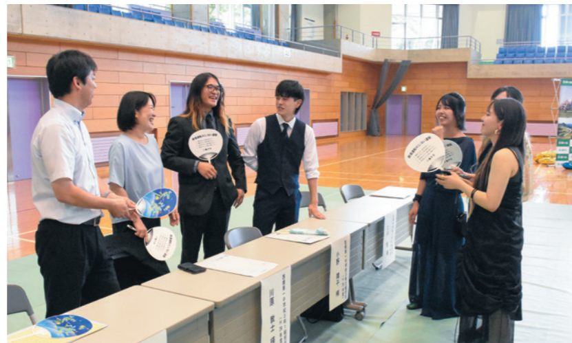
恩師との再会を喜ぶ