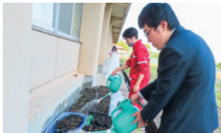
放課後活動での水まき