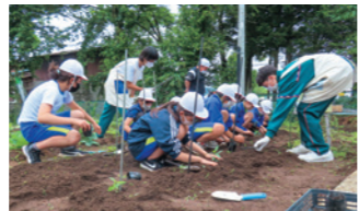
平笠小でムラサキを植栽