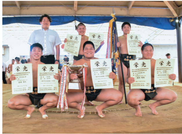
優勝杯や賞状を手に快心の結果を喜ぶ西根一中相撲部員