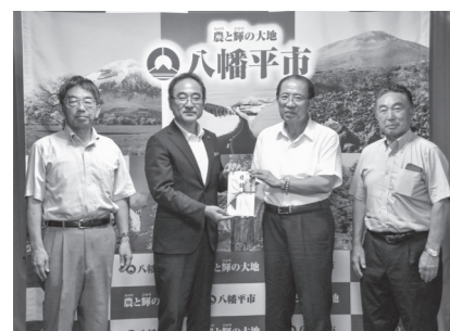
佐々木市長に目録を手渡す市建設協同組合理事長(右から2番目)

▼市建設協同組合様の8月7日、市のイベント財源への支援を目的に40万円が寄せられました。