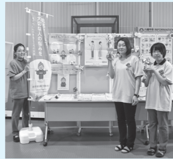
特設ブースにパンフレットや啓発グッズなどを展示しています

県では9月を「こころに寄り添い、いのちを守る いわて」月間とし、自殺予防の啓発活動を実施しています。市でも職員が「いのちを支える」Tシャツを着用するほか、市役所結のひろばに特設ブースを設置し、ストレスケアやこころの病気に関するパンフレットなどを展示・配付しています。