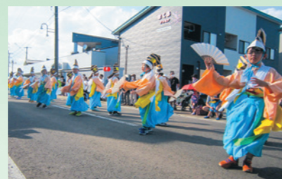
大泉院子安延命地藏尊例大祭連携イベントで岩手山神社山伏神楽を舞う平舘小児童(7月23日、平舘歩行者天国)