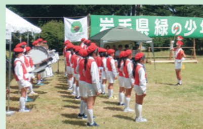
寄木小鼓笛隊の演奏で緑の少年団大会に集った14の少年団を歓迎(7月28日、県民の森)