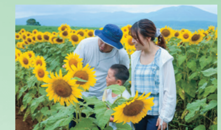
上村地区資源保全会が植えた約7,000本のジュニアスマイルが見頃を迎え多くの人が訪れた(8月16日、野駄地内)