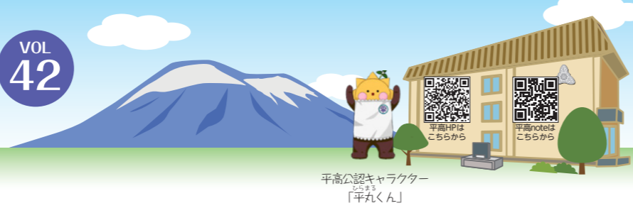
平高公認キャラクター「平丸くん」

平高の魅力や話題を発信します【問い合わせ先】平館高 ☎ 74-2610 HP: http://www2.iwate-ed.jp/tar-h/