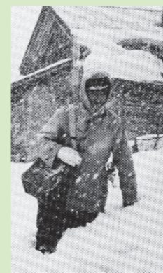
雪の中配達をする集配員

松尾鉱山は平館郵便局管内に属していましたが、大正15年10月、元山（現在の緑が丘）に貯金や為替を取り扱う無集配局として松尾鉱山郵便局が開局。しかし郵便の集配は平館局のままであったため郵便を出すにも受け取るにも大変時間がかかり、不便を強いられました。昭和16年2月に念願の集配事務が開始され住民には便利になりましたが、「松尾鉱山〇〇〇〇様」のように住所や住んでいる住宅名が書かれていない手紙があったり、表札のない家があちこちにあり1時間以上も探し回ったりと集配員は苦労したようです。そこで郵便局で