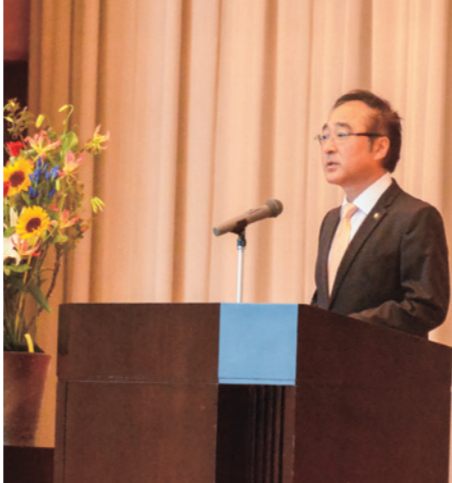
参加者に式辞を贈る佐々木市長