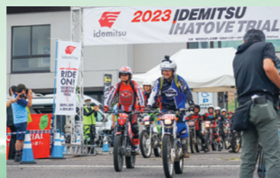
出光イーハートブトライアル大会が開催。険しいコースでライダーの技量を競う(8月26日、安比会場)