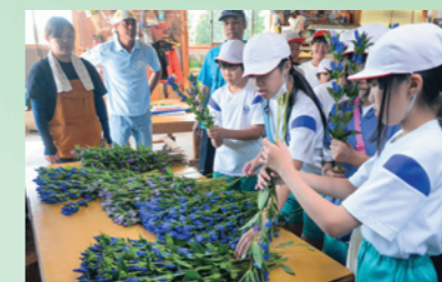
安代小・田山小の児童が、本年度3回目の「花育」授業でリンドウの収穫作業などを体験(8月23日、瀬ノ沢地内)