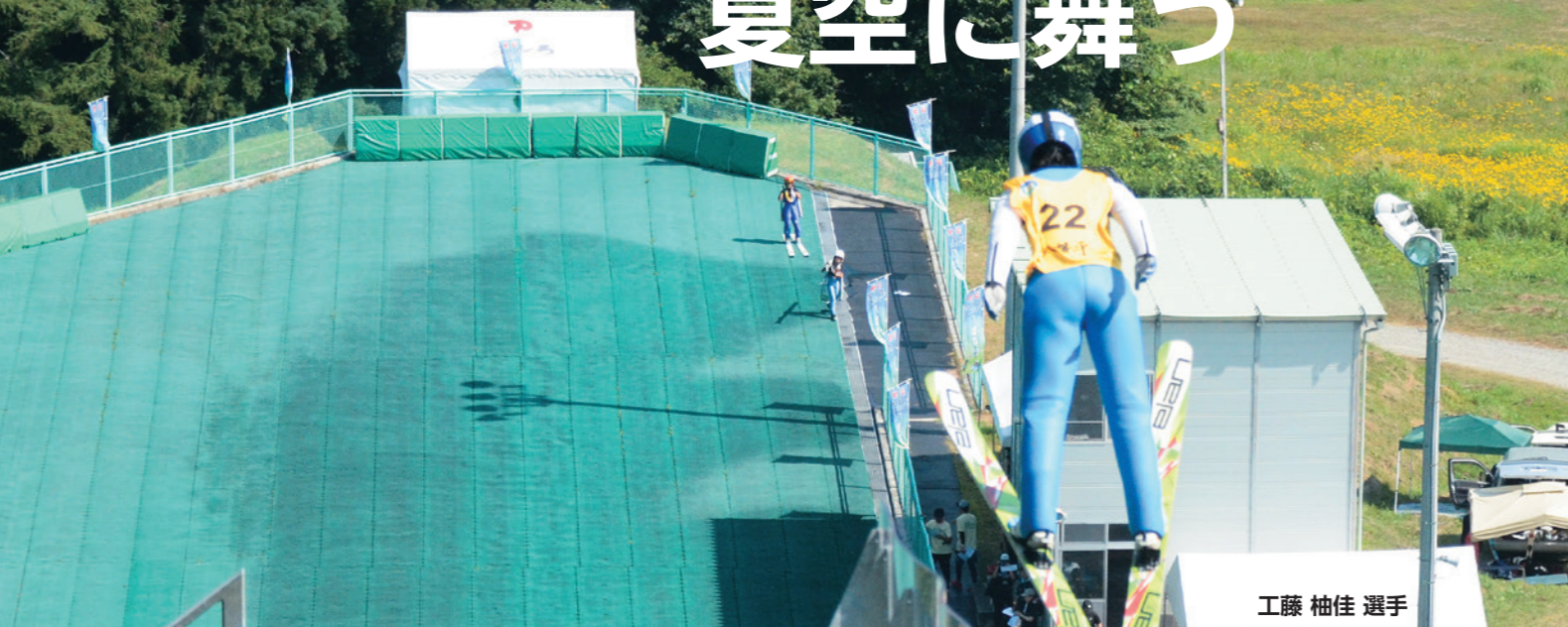
工藤 柚佳 選手