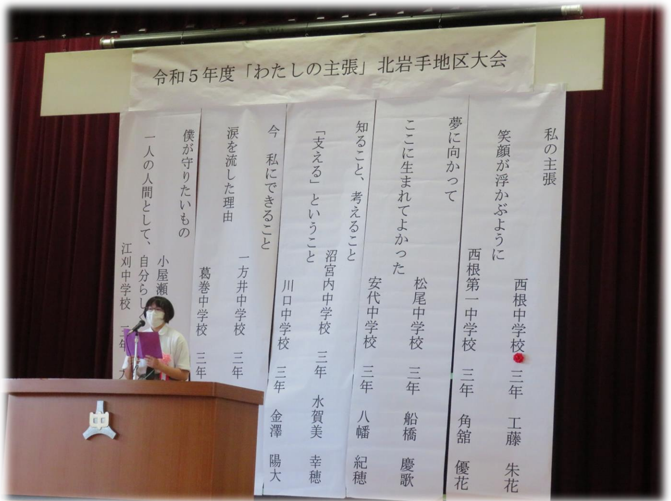
令和5年度の「わたしの主張」北岩手地区大会が本校で行われました。