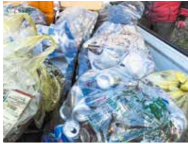
集められた多くのアルコール缶

問 過疎化が進む地域において、学校の廃止は過疎化に拍車をかけることになるため慎重な判断が必要ではないか。 教育長 学校統合は地域の現状やタイミングを考えながら判断したい。