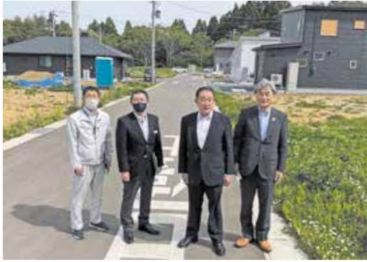
新しい家が建ち並ぶ定住促進団地