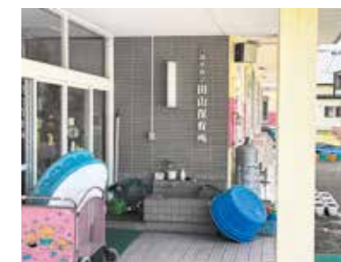
八幡平市立山田山保育所

問 全ての子どもの保育料無償化は実施できないか。 市長 利用が認定されない世帯など全ての子育て世帯への等しい支援とならない。幼児教育・保育料無償化の拡充は国の制度で検討するべきと考える。市の子育て支援策については、国や県