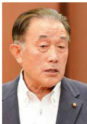
たかはし えつろう 高橋悦郎 議員 (日本共産党)