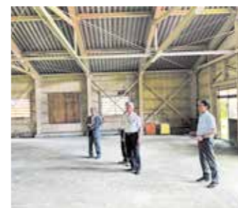
産業民生常任委員会が現地を確認 (7月6日)

必要な法令等を整備して、旧安代老人憩の家屋内ゲートボール場を令和8年4月まで使用させていただきたいこと。