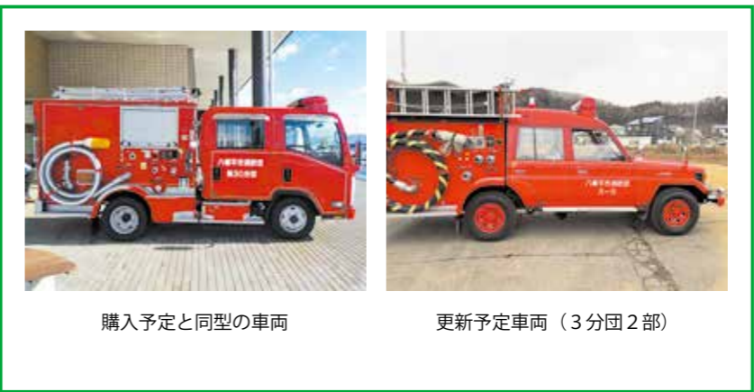
購入予定と同型の車両

6社の指名競争入札により、新たに消防ポンプ自動車を互光商事(株)から3025万円で購入するものです。