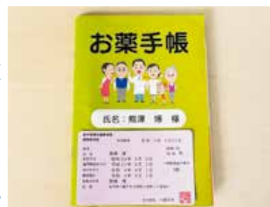
紙ベースの保険証とお薬手帳

市長 マイナカードを持たないことで、ひも付けされていない方を無保険状態にしてはならない。安心して医療機関を受診できるように担保されるべきである。