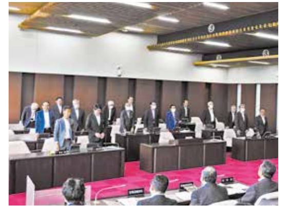
6月定例会議案採決(議案第19号)