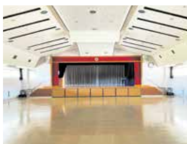
築40年の市民センター大ホール

問 これまで多くの方から望まれていた、市民文化会館の建設計画と市民や各種団体との協議会設立計画や今後の方針はあるか。