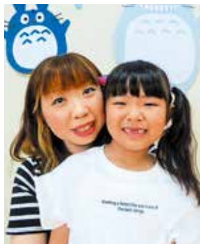
寺田保育所保護者会会長