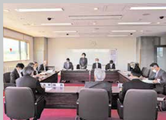
5月24日の宮古市議会視察受け入れ風景