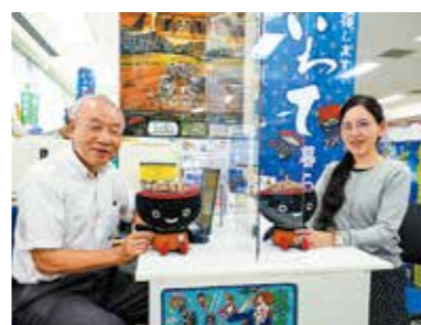
帰帰支援センターの岩手県ブース

問 移住支援金の増額内容と新規事業の若者・移住者空き家住まい支援事業補助金の具体的な推進対策は。