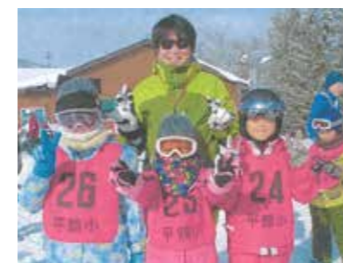
スキー授業は八幡平市の大切な財産

問 本年度より、小・中学校の学校給食費が12%増額になったが、今後、保護者の声や市民の声が大きければ、見直す考えはあるのか。 教育長 食材費が学校給食費より大きく上回る状況となり、市の財政運営に支障を来す状況のため、やむを