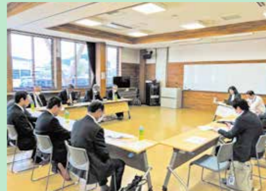
(株)八幡平DMOからの説明風景