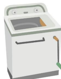
手回し脱水式洗たく機

※ このほかのものでも、捨てようかと迷われている古いものがありましたら、博物館へご相談ください。