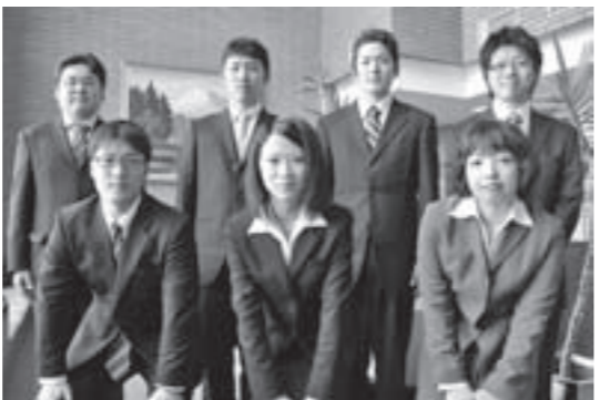
平成23年4月採用の市職員

平成24年度採用予定の市職員採用試験を次のとおり行います。 なお、薬剤師は1次試験日と試験会場が違うのでご注意ください。 ■職種・採用予定人数および受験資格 ▼一般事務職（若干名） 高校卒業以上（平成24年3月卒業見込みを含む）で、昭和60年4月2日以降に生まれた人 ▼建築技術職（1人） 高校卒業以上（平成24年3月卒業見込みを含む）で、昭和60年4月2日以降に生まれた人 ▼薬剤師（1人） 薬剤師免許を有し、昭和50年4月2日以降に生まれた人 ■1次試験日 9月18日（日）（薬剤師は8月30日（火）） ■試験会場 岩手県立大学（薬剤師は西根病院） ■申込方法 受験申込書（市企画総務部総務課、松尾・安代の各総合支所地域振興課にあります）に必要事項を記入の上、申し込みください。 ■申込期間 6月20日（月）から8月10日（水）まで（郵送の場合も8月10日（水）必着としますので、ご注意ください） ■郵送で資料を請求する場合は、90円切手を張った返信用封筒（「採用試験案内請求」と朱書きし、あて先・郵便番号を明記したもの）を同封して、市企画総務部総務課（〒028-7192）へ請求してください。 詳しくは、市役所総務課（☎・内線12211）まで。