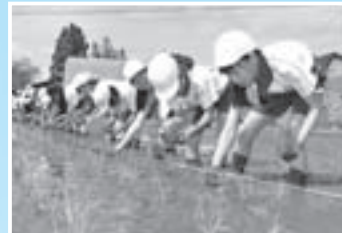
「いい天気にも恵まれました」 (5月27日、田頭小学校田植え)