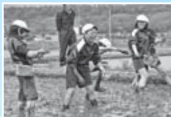
「尻もちについて思わず大笑い」 (6月2日、松野小学校田植え)