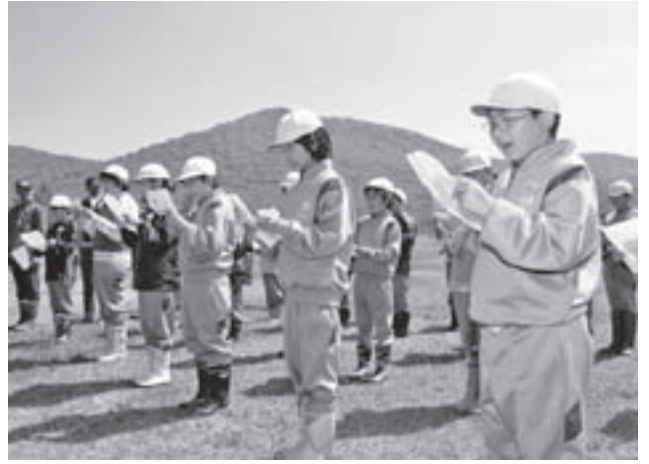
「みどりを大切にします」と、みどりの誓いを読み上げる児童たち

「遊々の森」は、学校教育や森林環境教育に国有林を利用できる制度で、調印式には約40人が出席。田村正彦市長と岩手北部森林管理署の野藤昌弘署長が、平成18年に締結した協定期間をさらに5年間延長する協定書に調印した後、安代小5年生25人が、声をそろえてみどりの誓いを読み上げました。