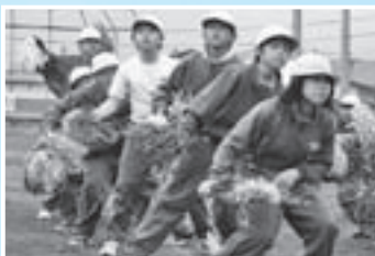
「息の合った踊りを披露」 (5月28日、東大更小学校運動会)