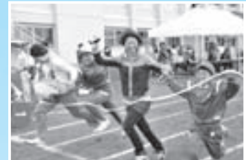
「勝利の女神はどちらに」 (5月28日、平舘小学校運動会)