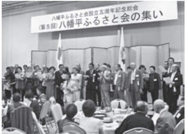
出席者全員による歌声が、会場いっばいに響きわたりました

なお、会場内に設置された募金箱には110,200円が寄せられ、今後市に贈られる予定となっています。