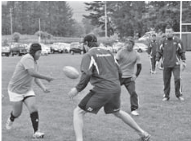
飯島前監督(写真右)の指導を受ける選手たち