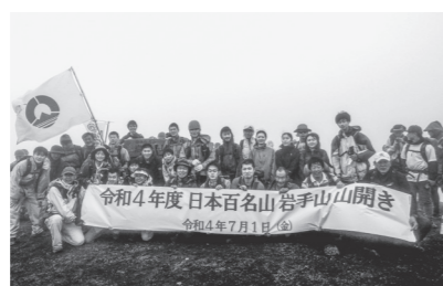
滝沢市・栗石町の山岳隊と山頂で合流「岩手山山開き」7月1日 焼走り登山口