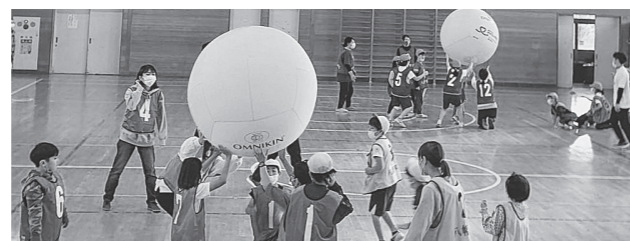
令和4年度ニュースポーツ教室の様子