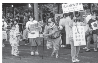
大更ガーデンフェスティバル「仮装盆踊り大会」7月8日 フーガの広場