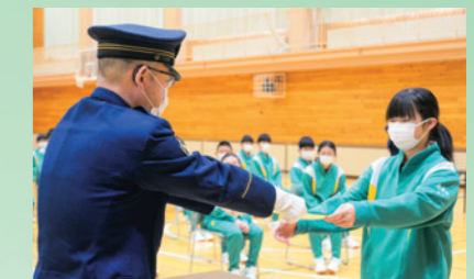
自転車を正しく運転し地域の模範となるよう自転車安全利用モデル校に指定される(4月11日、松尾中)