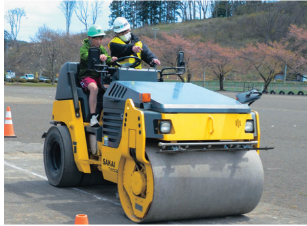
指示を聞きながら真剣な表情でローラーを運転