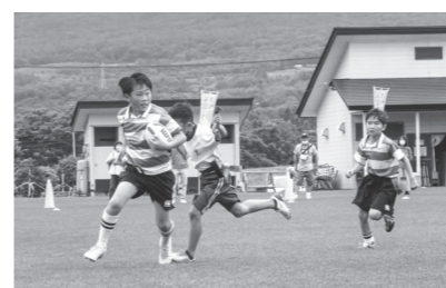
八幡平CUPタグラグビー大会 7月9日 市ラグビー場