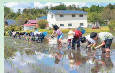
寺田小5、6年生の児童が地域の人たちの協力で昔ながらの田植えを体験(5月16日、寺田小付近の田)