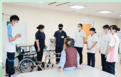
市内外の中高生10人が「ふれあい看護体験」で看護の心を学ぶ(5月11日、市立病院)