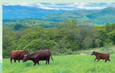
市宮牧野で放牧を開始。新緑の牧野に放たれた短角牛が青草をのんびりとむ(5月17日、七時雨牧野)