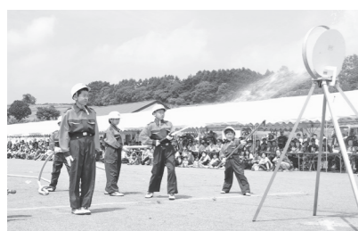
今年の消防演習には少年・幼年消防クラブも参加 6月25日 松尾地区総合運動公園