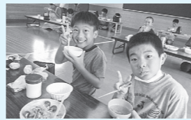
松野学童の「食育教室」

郷土料理体験や減塩・適塩料理など、要望に応じてサポートします。幅広く相談に応じますので、ぜひ、活用してください。