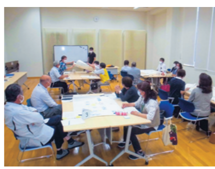
民生委員・児童委員によるワークショップ

③ 包括的支援体制の構築に向けて多機関の連携を深める 複雑な地域生活課題や支援ニーズに対応するため、断らない相談支援、参加支援および地域づくりに向けた支援について、相互の連携を深められる体制を目指します。 市はこれらの取り組みを通して、本計画が目指す地域づくりを進めていきます。