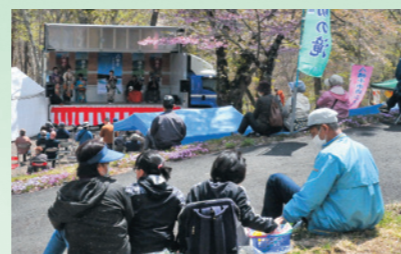
桜舞う不動の滝まつりが安代地区に春の到来を告げる(5月3日、桜松公園)

野 焼きによる煙や悪臭の苦情が寄せられています。野焼きは法律で原則禁止されています。小規模なたき火、どんと焼き、農地管理のための枯草の焼却(風俗慣習や宗教上の行事、農業などを営むためにやむを得ないもの)などは一部除外されています。