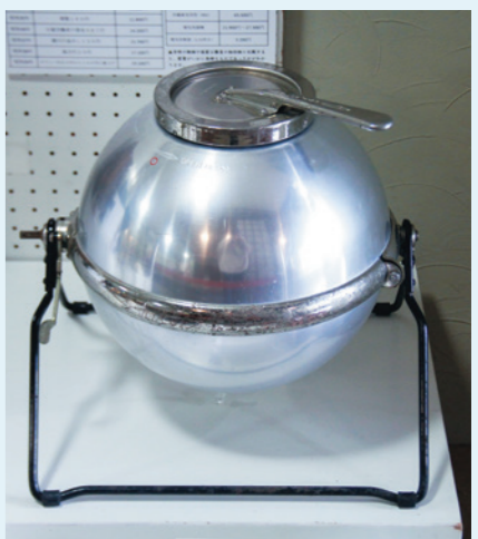
手回し式洗濯器 博物館蔵

が理論を構築した圧力洗濯法を応用したもので、昭和32(1957)年、群馬県の林製作所が製造・発売しましたが、同じ時期に発売を開始した電気洗濯機に押され、残念ながら昭和38(1963)年に生産を中止しました。しかし同様の仕組みを利用した手回し式洗濯機が、電気を使わないエコな洗濯機として現在でも販売されており、最近ではキャンプや災害の際に使える便利な道具として注目されています。