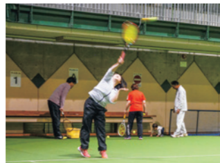
強烈なサーブを打ち込むメンバー

ストローク、ボレー、サーブなどの基礎練習や試合を想定したパターン練習などを行います。他チームのメンバーが練習会に参加することもあり、楽しいながらも激しい練習に取り組んでいます。県テニス協会が