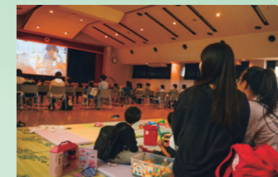
「わくわく八幡平」設立準備委員会が子ども会議開催に向け映画を上映(5月14日、西根地区市民センター)