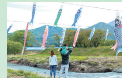
子どもたちの成長を願って色とりどりのこいのぼりがはためく(4月30日～5月7日、松川下ノ橋付近)