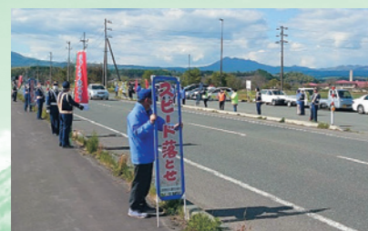
交通安全協会や交通安全協会母の会、交通指導隊が、安全運転を呼び掛け(5月11日、春の全国交通安全運動)