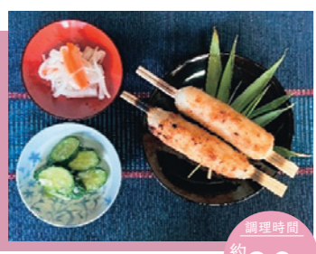
-1本当たり- 約30分 187kcal/塩分0.9g

今月は くるみみそつけたんぽ 安代地区では、新米がとれた時のご馳走として人が集まる時に食べられていきます。昔は大きな串にご飯を1合ほどつけ、囲炉裏に串を刺して焼いていました。