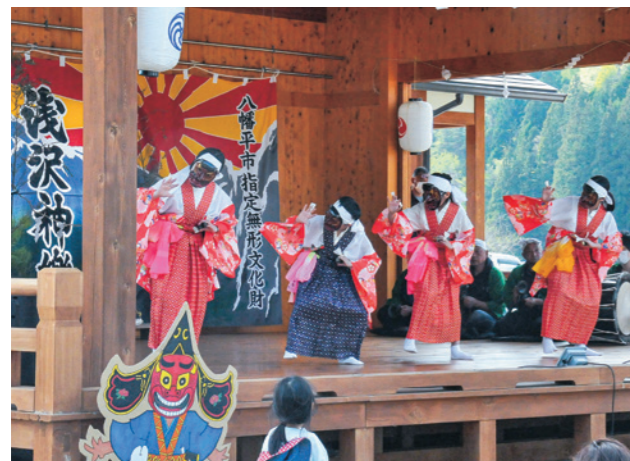
荒々しくも、かわいらしい動作で「虎の口」を踊る子どもたち