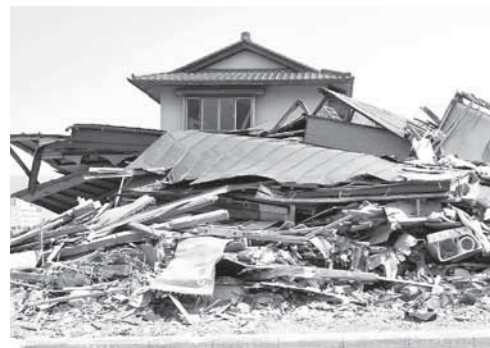
地震で倒壊する前に耐震診断・改修を受けましょう (写真はイメージです)