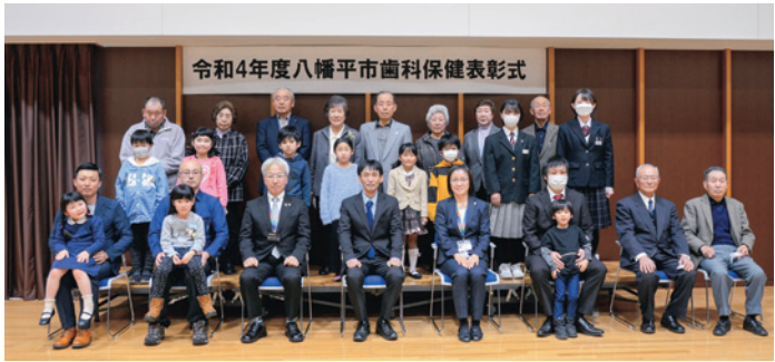
表彰式に出席した受賞者の皆さん