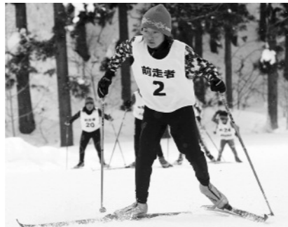
トレーニングの一環・スキー大会の前走

田山スポーツ少年団は、昭和47年に設立されたスポーツ少年団です。これまで、全国大会への出場や県大会などでの入賞などを果たしています。現在は、小学校2年生から6年生までの27人が所属。同スポーツ少年団には、スキー(アルペン・クロスカントリール・ジャンプ)、ソフトボール、本年度から始まった