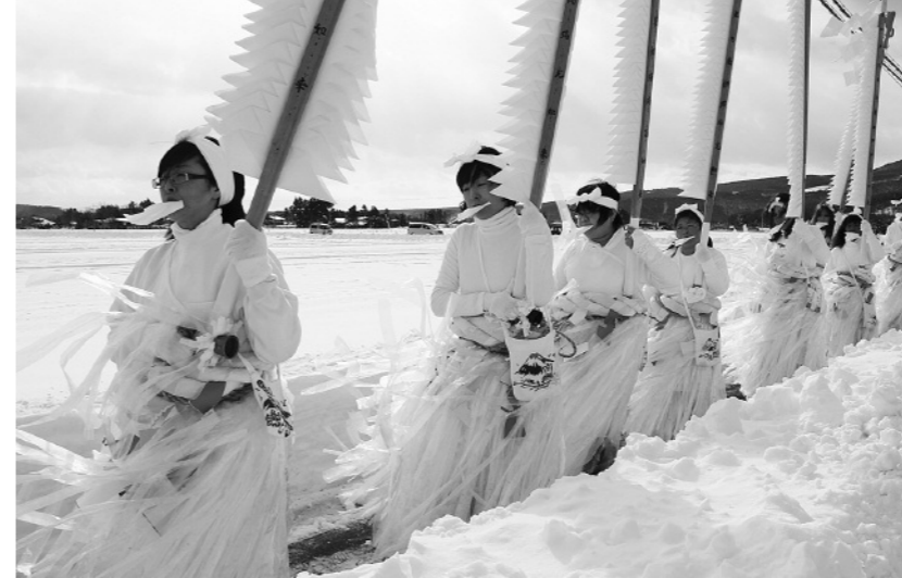
冷え込みの中、時折吹く強風に耐えながら、参加者は歩を進めました