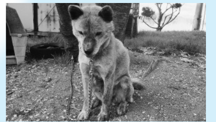
犬には身元を表示してください