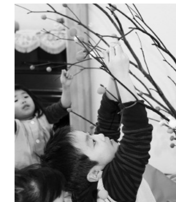
餅花づくり(あしる保育所畑分園)

博物館では、各施設・個人への出前講座を行っています。1月は旧正月にちなんで、餅花(みずき団子)づくりや正月遊び(こま、たこ、かるた、竹とんぼ、折り紙など)を体験してもらいました。主に市内の保育所での開催でしたが、子どもたちは、初めて体験する遊びに、みんな夢中になって遊んでいました。