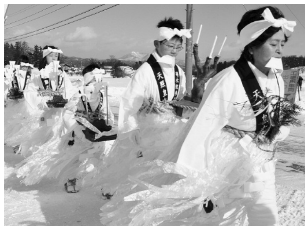
江戸時代に岩手山噴火の沈静化を願い始めたといわれる同裸参り