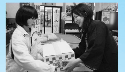
道の駅にしね・HAPPY八幡平コラボ企画 「HAPPYBOX」販売（1月4日、道の駅にしね）