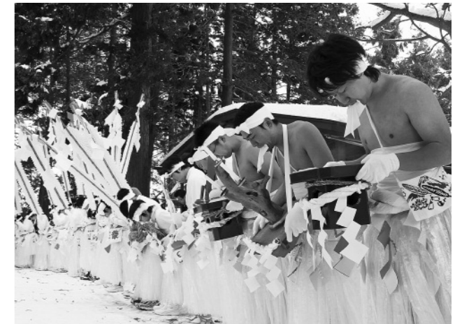
出発地点の平笠・宮田神社で裸参りが無事終わることを祈る参加者

女性16人を含む29人の参加者は、白装束姿に験竿を掲げ、無病息災や五穀豊穡を祈願しながら大更の八坂神社までの約10キロを約5時間かけて練り歩きました。