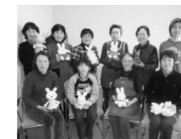
完成した作品をみんなで披露

1月14、16日の2日間、今年の干支「うさぎ」のあみぐるみを作る教室を開催しました。2日間で延べ18人が参加し、自分好みの作品を完成させました。