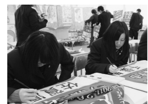
のほり旗に都道府県名を書き入れる生徒たち

スキーが日本に伝わって100年の今年、全国の高校生スキーヤーが八幡平市に集結し、熱戦を繰り広げる。第60回全国高等学校スキー大会(スキーインターハイ)が2月6日から10日まで、八幡平市を舞台に開催されます。今年で60回目の「還暦」を迎えたスキーインターハイ。「雪原に馳せる情熱 イーハトーヴの華となれ」を大会スローガンに、参加41都道府県の選手・役員など、全国から約2000人が八幡平市に集まります。昨年は全国中学校スキー大会、おとしは全日本学生スキー選手権大会と、全国規模の大会が続く県内の「スキーの聖地」八幡平市。スキーインターハイは、平成9年に旧安代町で開かれた第46回大会以来、14年ぶり4回目の開催となります。大会に向け、1月は県高等学校スキー大会など出場権を懸けた大会も行われ(6、7ページ参照)、八幡平市からは18人(岩手16人、秋田2人)が地元の大舞台に挑む権利を得ました(顔ぶれは次ページのとおり)。同じ高校生の冬の祭典を盛り上げるため、平館高校(中