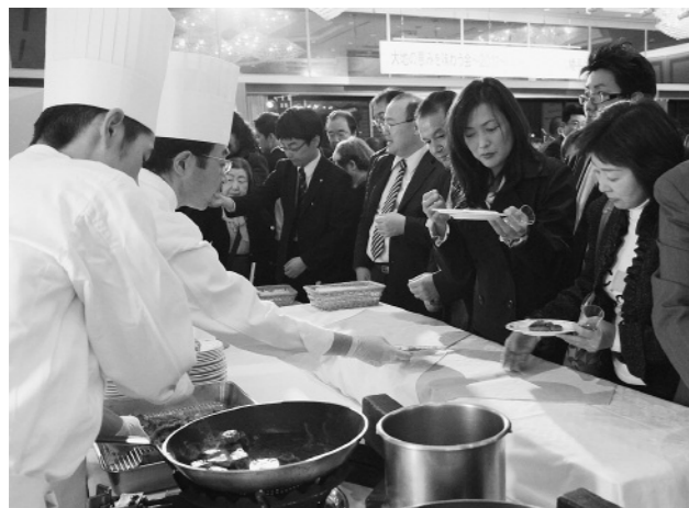
八幡平牛のステーキには順番待ちの行列ができていました