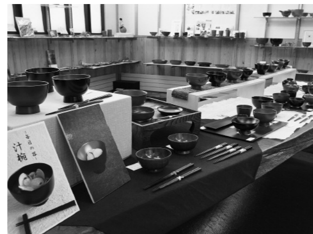
大きさ、形、色。さまざまなお椀が並びました