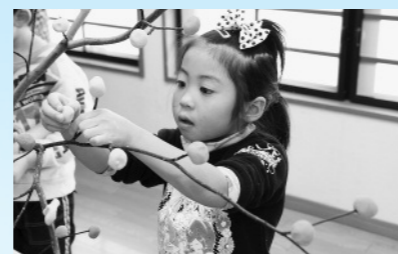
みずき団子づくり （1月14日、あしる保育所）