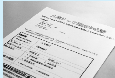
助成を希望する人は期限内の申し込みを

寒い季節につらい冷え性を解消しよう 毎日寒い日が続き、手足などの冷えを感じる人も多いのではないのでしょうか。冷え性の原因は、血行不良や体温を調整する機能・自律神経の異常といわれています。冷え性を改善し、快適な冬を過ごしましょう。 ◆簡単にできる冷え性の対策 ①保温に気を付ける 下着や衣類で工夫し、体を温めるようにしましょう。体の中心部を冷やさないことが大切です。 ②入浴で体を温める シャワーだけで済ませず、ぬるめのお湯で、ゆっくりお風呂に入り温まりましょう。熱いお湯は、体の表面しか温まらず、湯冷めしやすいので避けましょう。 ③食事を工夫する ほうじ茶や紅茶などの茶色の飲み物、食べ物では、にんじんやごぼうなどの根菜類、赤や黒の野菜が体を温めてくれます。また、しょうがや唐辛子は、新陳代謝や内臓の働きを活発にし、体を温めるのに効果的です。ぜひ食事の中に取り入れましょう。