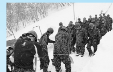
自衛隊の協力による矢神飛躍台整備 （1月5日、矢神飛躍台）