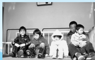
防災とボランティア週間・防災意識啓発活動 （1月16日、マックスパルコ西根店前）