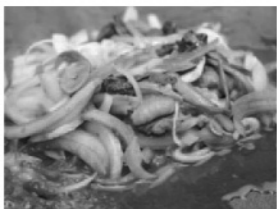
新名物料理カンカン焼き