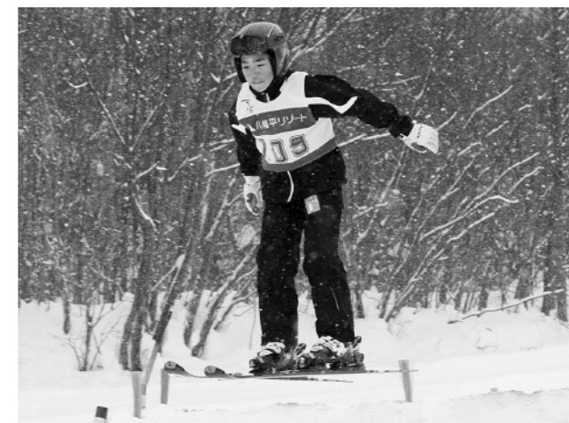
スピードに乗りジャンプ台から飛び出す参加者

ジャンプ体験教室(県スキー連盟主催)は1月9日、八幡平リゾートパノラマスキー場で開かれました。市内と盛岡市の小学生11人が挑戦。同連盟ジャンプ部のスタッフからアプローチを滑る姿勢や踏み切り方の指導を受け、スキー場内に造られたアプローチ、踏み切り台、ランディングバーンがある特設の小型ジャンプ台を飛び出しました。参加者の中には飛びだすに飛距離を伸ばす人もいて、ジャンプ選手が味わう「飛ぶ感覚」に触れました。