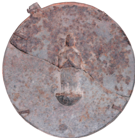
てつ ぞう ぼ さつりゅうぞうかけぼとけ 鉄造菩薩立像懸仏

所在地：西根寺田15-127(西根歴史民俗資料館) 寸法：直径28cm 指定年月日：昭和53年8月31日(旧西根町指定)