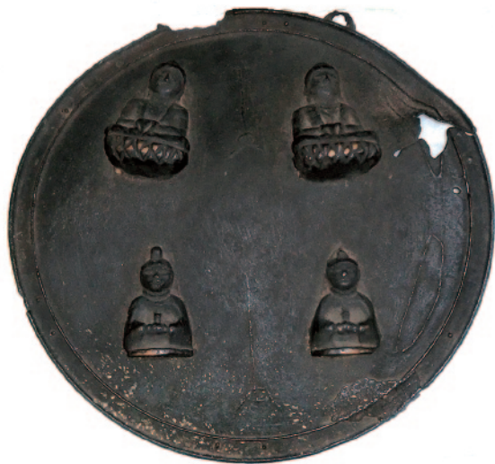
あか どう ばん かけぼとけ 赤銅板懸仏

所在地：西根寺田15-127(西根歴史民俗資料館) 寸法：直径28cm 指定年月日：昭和53年8月31日(旧西根町指定)