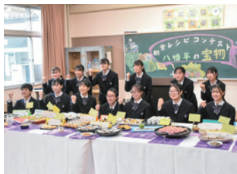
完成した力作を前にガッツポーズ

家政科学科3年ライフデザインコース13人による朝食レシピコンテスト「八幡平の宝物」が11月17日、平高で開催されました。コンテストは、新安比温泉静流閣様から「高校生が地元の食材に親しみ発信する機会になれば」と提案があり初めて開催したもので、生徒は市産の食材を用いた朝食レシピの考案と