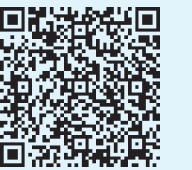
児童手当について詳しくはこちらへ