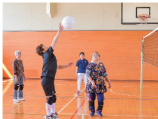
強烈なアタックを決める

バレーボールよりも柔らかいボールを使い、ウォーミングアップをして体を温め、試合形式でプレーしています。人数が少