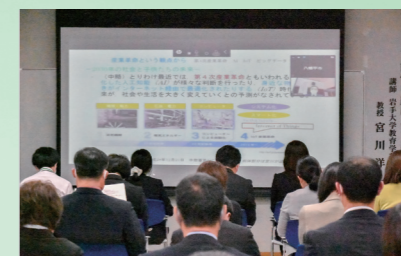
オンラインで2会場をつなぎ開催した市教育研究所教育講演会(4月30日、市役所多目的ホール棟)