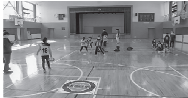
令和2年ニュースポーツ教室の様子