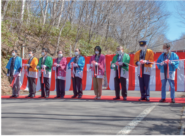
雲一つない快晴の中、テープカットで開通を祝福