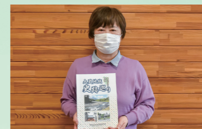
大更地区の史跡などを一冊にまとめ出版(5月10日、大更コミュニティセンター)