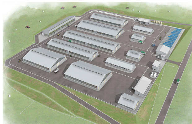
繁殖・育成センター完成予想図