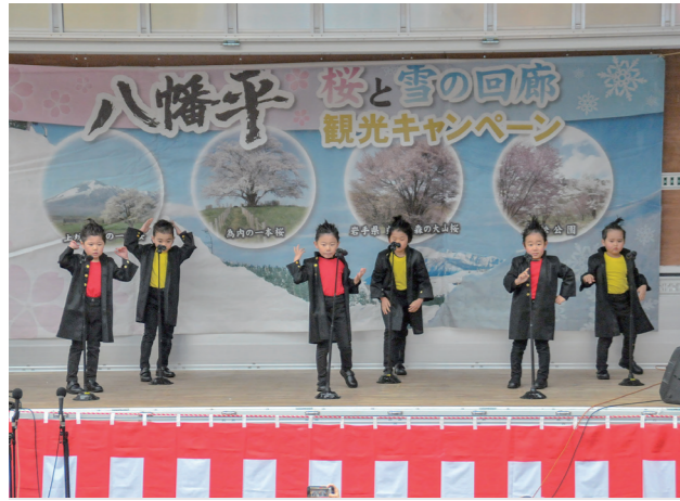
オープニングで元気に踊るあしろこども園の園児たち