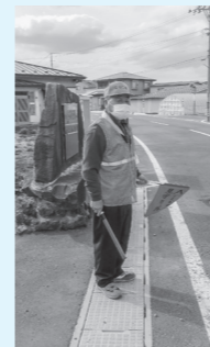
見守り活動をする会員

地域の宝である子どもたちの安全を守るため、登下校時の見守り活動に会員と有志で取り組んでいます。また、会員同士の親睦を深めるため、夏は屋外グラウンドゴルフ場、冬は屋内練習場で年間を通してグラウンド