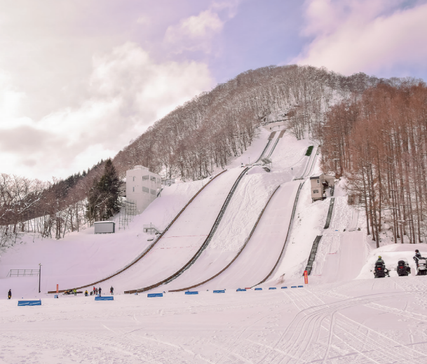
矢神飛躍台ノーマルヒル(左)のアプローチを改修