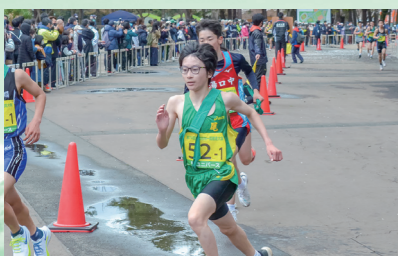
盛岡市内一周継走大会が2年ぶりに開催し、257チームが参加(4月18日、県営運動公園陸上競技場)