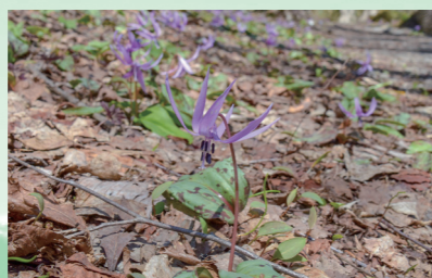
松川玄武岩歩道付近に群生する春の妖精カタクリの花(4月23日、松川渓谷)