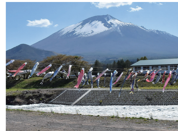
昨年より30匹増え、二列で泳ぐこいのぼり

牛たちは閉牧となる11月ごろまで、気の向くまま駆け回ったり、草を食んだりしてのんびり過ごします。