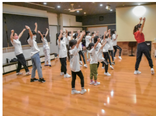
リズムに合わせて踊る生徒たち

「ダンスで地元を元気に!」をコンセプトに活動しています。コンテストやオーディションなど岩手にいながらも挑戦できる環境づくりに努めています。