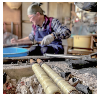
丁寧に焼き上げられる麩

今 月は、安代地区の「手焼 き麩」職人を紹介しま す。たまたま立ち寄った店 で、機械化が進む中でも手焼 きに誇りをもって焼き続け る職人さんがいることを知 りインタビュー。聞けば長 年、一流老舗料亭にも卸して いる歴史ある店とのこと、 麩を作る熟練の手つきに感 動しました。焼きたてを味 わってみると、これまで食 べていたものとは比べもの にならない味わいに感激しま した。言葉で表現しきれない 部分は今後、動画で紹介して いきます。