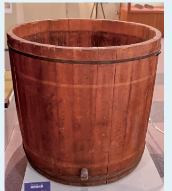
柿渋溜め樽(当館蔵)

柿渋作りは、熟す前の豆柿を採取し、それをほどよく潰すところから始まります。樽などの大きい容器に潰した豆柿を入れて水を流し込み、重しを乗せて発酵するまで約1カ月。渋は上部に溜まり、それを汲み取ってわらやそば殻を入れた籠の上から流して濾すことで、ようやく柿渋として使用できる状態となりました。柿渋の用途は多く、和紙に塗って乾かしたものを雨がっぱ・風呂敷・うちわとして使うほか、防水性の高さから魚を捕る漁具にも塗られるなど、さまざまな用途で人々の暮らしを支えていました。