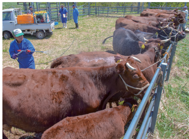
放牧前の牛体消毒で体の汚れなどを落とす