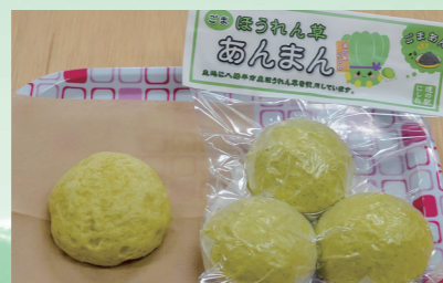
中のあるをゴマあんに改良し、ほうれん草あまんの販売を再開(5月1日、道の駅にしね)