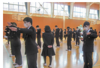
応援歌練習に臨む新入生

昨年度は新型コロナウイルス感染症の感染防止の観点から、大声を出すことや三密を避けるため、応援歌練習を中止していましたが、本年度は、生徒間の距離を十分に空け、ドアを開けて空