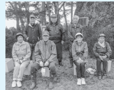
グラウンドゴルフ場整備に参加した会員たち

ゴルフに励んでいます。グラウンドゴルフは活動の中でも長い歴史があり、会員も誇りを持っています。その他にも、ニュースポーツ交流会と三世代交流会への積極的な参加、花壇管理などの地域美化運動、年7、8回の七時雨憩の湯でのビンゴゲームやカラオケなど楽しく活動しています。