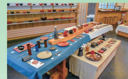
「うるしとおやつ展」を開き、約100点の漆器を展示販売(4月29日～5月9日、安比塗漆器工房)