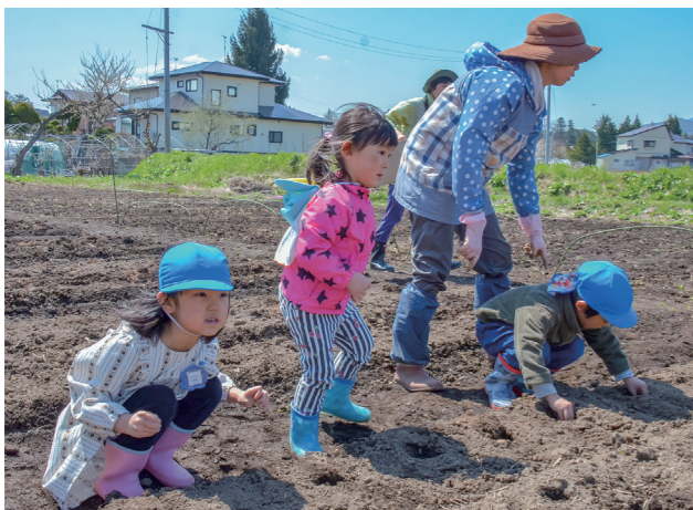
両手に持った種イモを優しく植え付ける園児