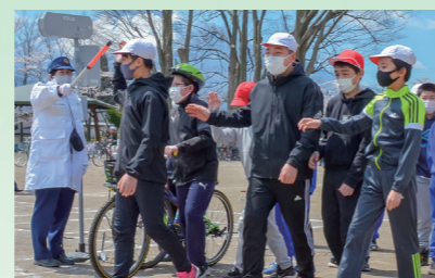
正しい交通ルールを学び事故の発生を防ぐ春の交通安全教室を開催(4月22日、大更小校庭)