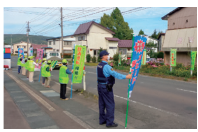
昨年の秋の交通安全運動の様子

[広告] この広告は、広告主の責任において市が掲載しているものです。広告の内容について市が推奨などをするものではありません。