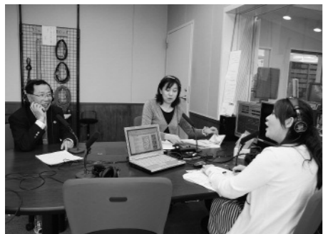
10月5日に放送された第1回目の放送では田村正彦市長が生出演

10 月5日からエフエム岩手ふるさと元気隊八幡平の今を届けるラジオ番組がスタートしました。番組名は「HAPPY 八幡平」。市の観光やイベント、特産品、市内で活躍する人など八幡平市の魅力を県内外に発信しています。9月24日に行われた開局式で、佐々木浩支局長は「取れたての新しい情報を発信する『産地直送』の番組づくりを目指したい」と意気込みを見せました。同支局には4人のスタッフが常駐しています。 番組は、来年3月末までの毎週火曜日、正午から55分間の生放送。毎週火曜日のお昼のひとときは「HAPPY 八幡平」をぜひお聴きください(周波数は盛岡FM76・1MHz、二戸FM82・2MHz)。