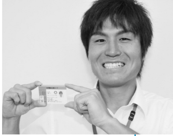
今が無料交付のチャンスです

金融機関など、さまざまな場面でも身分証明書を提示する機会が増えていきます。住民基本台帳に基づき作成される「写真付き住基カード」は、運転免許証やパスポート同様、公的身分証明書として使うことができます(有効期間10年)。今なら、写真付き住基カードの交付を無料で受けることができます。この機会を利用して交付を受けましょう。(平成23年3月31日まで。通常は1件500円) ■手続きに必要なもの 免許証やパスポートなど写真付き身分証明書(お持ちの方のみ)、履歴書用写真1枚、認め印 ■受付窓口 市市民部市民課(市民課に写真付き身分証明書を持参すれば、即日交付が可能です)、松尾・安代総合支所 地域振興課、田山支所 ■受付日時 毎週月曜日から金曜日まで(年末年始、祝日を除く)、午前9時15分から午後4時半まで 詳しくは、市市民部市民課(☎・内線11335)まで。