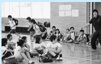
「不審者だ。それ逃げる」 (7月22日、東大更小防犯教室)