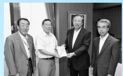
「8月15日の市夏まつりに50万円寄付」 (7月30日、市建設協同組合から)