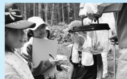
「積水メディカル岩手工場裏山で自然観察」 (7月24日、セキスイこども自然塾)