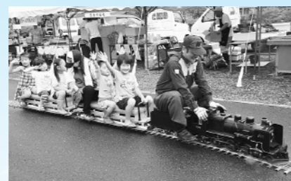
「ミニSLも登場しました」 (8月1日~2日、はちまんたい産直大集合)