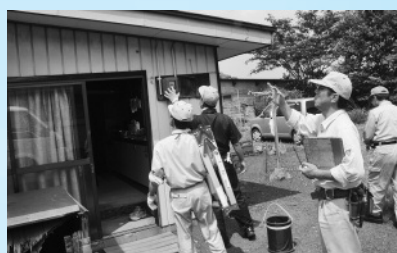
「高齢者宅電気設備の奉仕点検を実施」 (7月28日、東北電気管理技術者協会)