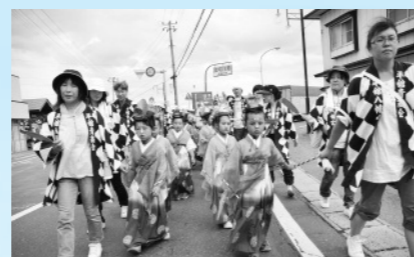
「年長児が、約2時間練り歩きました」 (7月23日、平舘子安延命地藏尊稚児行列)