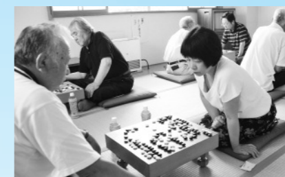
「次の一手は…」 (7月25日、西根囲碁愛好会定例囲碁大会)