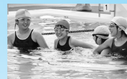
「水中4人5脚、陸上よりムズカシ〜」 (7月26日、アクアキッズフェスティバル)