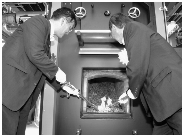
火入れを行う協和エクシオの桐林環境本部長(写真左)と田村市長