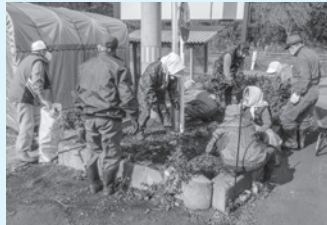
花壇を整備する会員

新型コロナウイルス感染症が落ち着いたら、例年行っていた花見やタケノコ狩りを再開したいです。また、過去に行っていたキノコ採りを復活させたいと思っています。