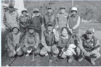
グラウンド・ゴルフを楽しみに集まる会員

パークゴルフとグラウンド・ゴルフが得意な会員が多く在籍しています。市のグラウンド・ゴルフ団体が設立される前から競技に励んでいて、安代地区への競技普及の先頭に立って活動しました。市内のパークゴルフ大会では、会員がいつも上位に入賞している。11月に行われた大会でも2位と3位に入賞しています。学習意欲も高く、館市コミュニ