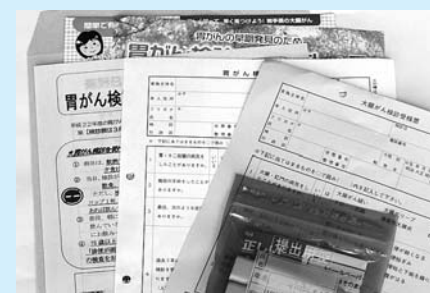
がん検診を受けましょう