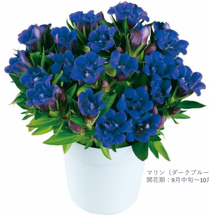
マリン（ダークブルー） 開花期：9月中旬～10月中旬