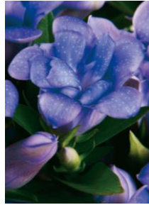
アクア（ライトブルー） 開花期：9月中旬～10月中旬