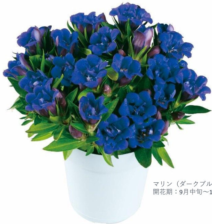
マリン（ダークブルー） 開花期：9月中旬～10月中旬

八幡平市で育種された最新品種の八重咲リンドウ。従来のリンドウより花持ちの良さが向上し、より長く鑑賞できるのが特徴。株のボリューム感が花束のような印象からこの名前が付いた。2021年初出荷。ダークブルー、ライトブルー、ピンクの3色展開。