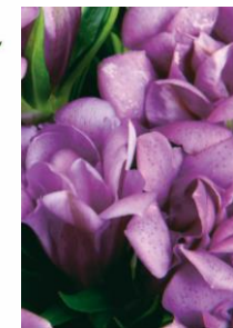
ロゼ（ピンク） 開花期：9月中旬～10月中旬