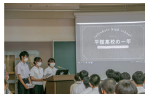
平高の活動を紹介する生徒会

例年より参加人数は少なかったとはいえ、趣向を凝らした部紹介など大いに盛り上がりました。