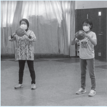
ボールを使った運動の様子

市内3カ所の温泉施設では、介護予防を目的とした高齢者健康教室を開いています。教室では、週1回の体操やヨガ、グラウンド・ゴルフなどの運動のほか、年1回の体力測定、年3回のリハビリテーション専門職とシルバリーリハビリ体操指導者による体操やリハビリ運動なども行っています。また、運動後は、温泉と食事を楽しむことができます。