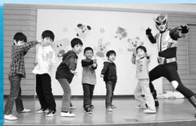
柏台保育所お別れ会 (3月5日、柏台保育所)