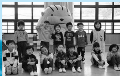
「I・A・T子育て応援宣言〜ゴエ天〜」収録 (3月1日、安代保育所)