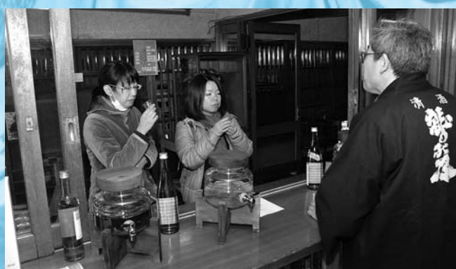
試飲では、八幡平市の地酒・わしの尾を味わうことができました