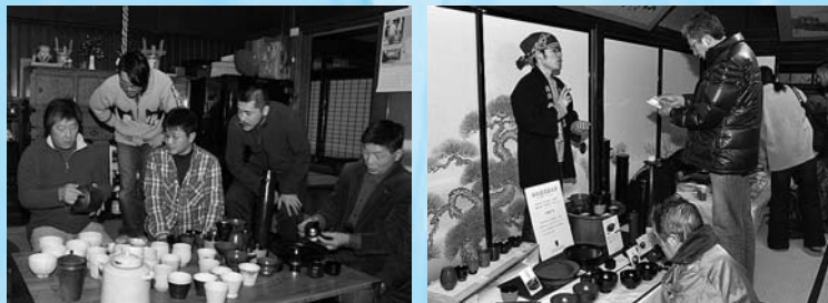
事前打ち合わせにも力が入る出展者 作家本人との交流も展示会の魅力