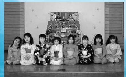
ひな祭りお茶会 (3月3日、柏台保育所)