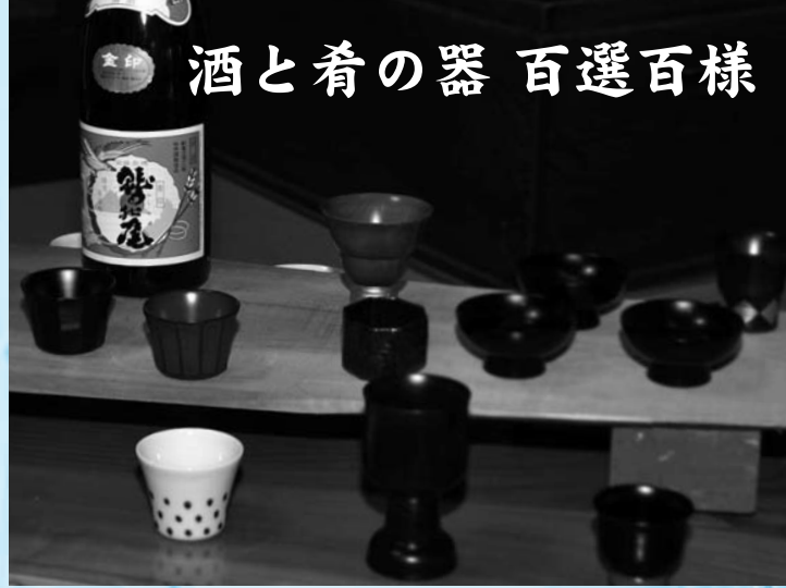
酒と肴の器 百選百様