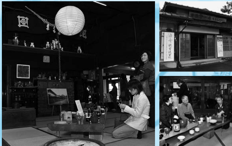
↑築250年の建物だけでも一見の価値がある、(株)わしの尾旧事務所

と思う。昔の建物のいい雰囲気を感じながら、展示会を楽しんでほしい」と展示会への思いを聞かせてくれました。会場となった旧事務所は、築250年といわれ、今回初めて一般に開放してイベントが行われました。趣ある雰囲気の中で開催された展示会に、市内外から千人を超える来場者が訪れ、作家との会話を楽しみながら、作品を手にとっていました。 また会場では、(株)わしの尾の日本酒試飲、手打ちそばや酒かすの揚げ物の試食、酒蔵見学なども行われました。