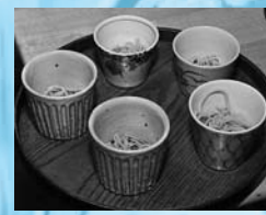
↑試食の手打ちそばの盛り付けには、出展作家の器が使われました