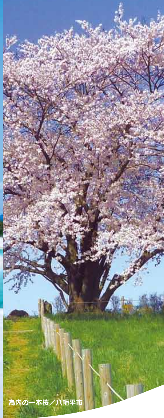
為内の一本桜／八幡平市