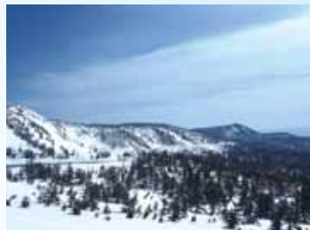
●見返り峠から岩手方面を望む