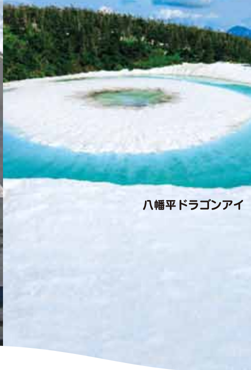
八幡平ドラゴンアイ