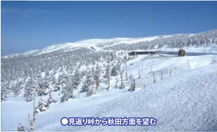
●見返り峠から秋田方面を望む