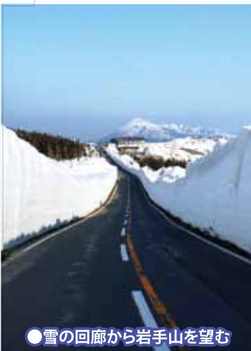
●雪の回廊から岩手山を望む