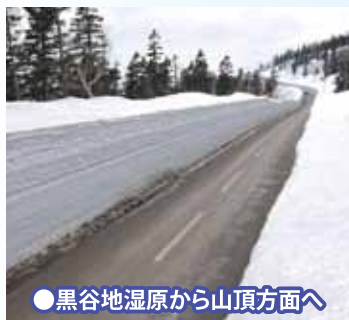
●黒谷地湿原から山頂方面へ