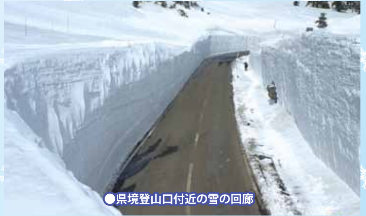
●県境登山口付近の雪の回廊