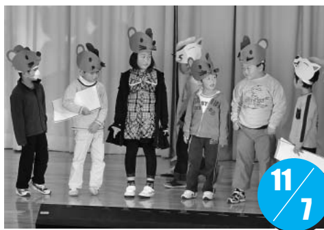
1年生による劇の一幕