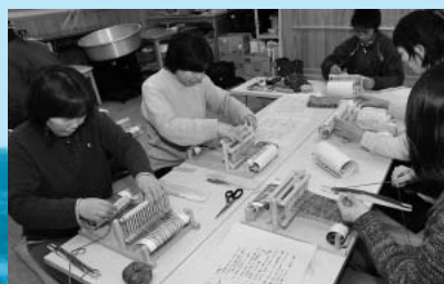
マフラー織ワークショップ (11月3日、安比塗漆器工房)