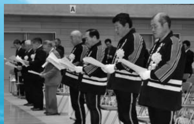
市民憲章推進大会 (11月3日、市総合運動公園)