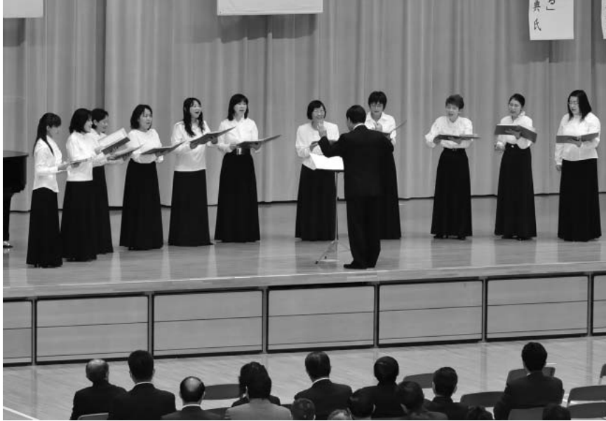
市民交流の集いにコーラス白樺が出演し、式典に花を添えました

八幡平市市民憲章推進大会は11月3日、市総合運動公園体育館で開催されました。約300人の参加者全員で市民憲章を唱和した後、まちづくり尽力した功労者15人、地域貢献などの善行者3人を安比塗の賞状で表彰しました。表彰を受けた皆さんは次のとおりです。(敬称略)